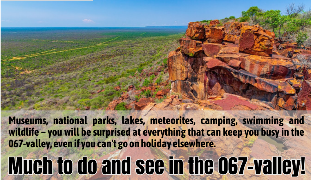
Waterberg Plateau Park

Museums, national parks, lakes, meteorites, camping, swimming and wildlife – you will be surprised at everything that can keep you busy in the 067-valley, even if you can't go on holiday elsewhere.